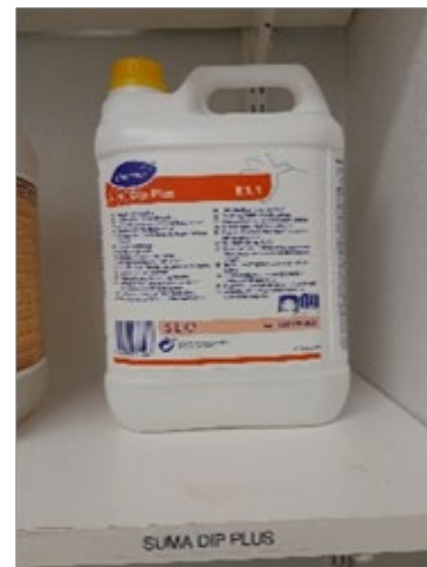
astioiden liotus- ja valkaisuaine