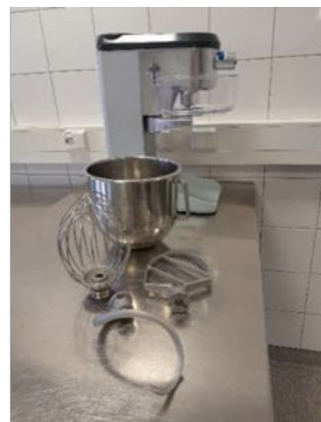
pieni yleiskone, pöytäkone