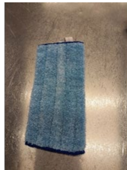
moppi (muut pinnat)