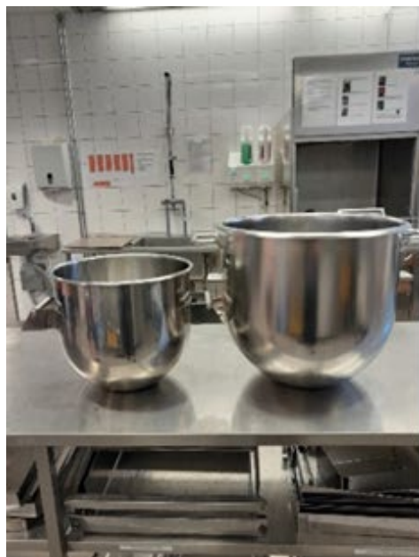
pieni taikinapata, iso taikinapata