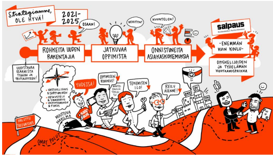
Katso Salpauksen strategiavideo Strategia, säännöt ja ohjeet - Koulutuskeskus Salpaus