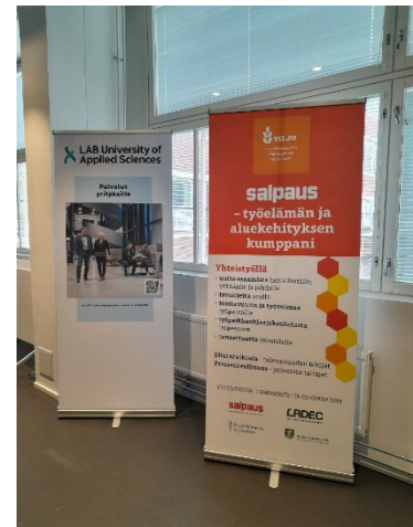
Salpaus työelämän ja aluekehityksen kumppani

Kuuntelimme ja kohtasimme työelämää. Todensimme työpaikkaohjauksen merkityksen ja tason. Suunnittelimme ja toteutimme opetusaloilla monia koulutuksia, uudistimme selkokielisiä oppimateriaaleja ja työvälineitä sekä teimme koonnin elintarvikealan koko koulutustarjonnasta.